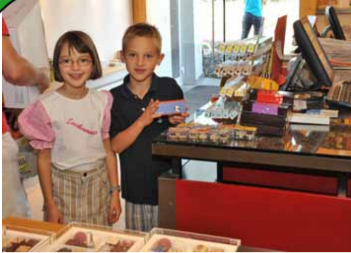
Unser Traumpaar mit Zuckermaus-Leiberl und der „Für Dich“-Schoki.