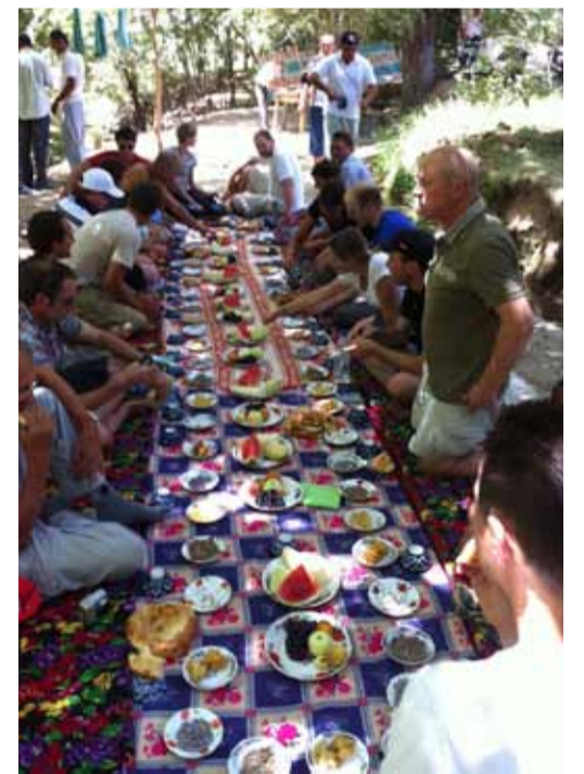
Idyllisch: Unser Picknick-Festessen

pektiven und ertränken ihre Sorgen im Wodka. Ausländische Investoren kommen nur ganz selten. Marap ist da eine echte Ausnahme – ein Projekt, das Chancen bietet, neue Standards setzt und zeigt, dass es auch in Usbekistan möglich ist, kontrolliert biologische Landwirtschaft zu betreiben, die Mitarbeiter und Bauern fair zu entlohnen und diese fabelhaft guten Goldkirschen herzustellen.