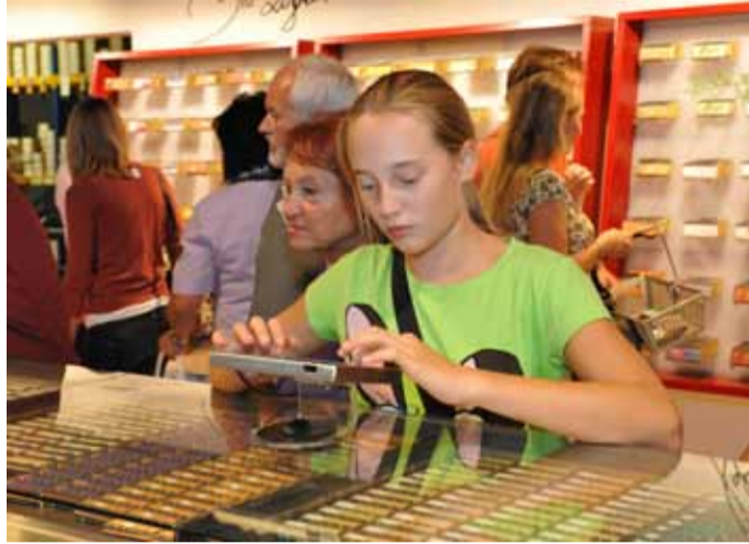
Mi-Xing-bar: Mit ein paar Klicks eine eigene Schoko kreieren.

Einmal im Jahr am letzten Septemberwochenende laden wir alle Besucher zum Tag der offenen Tür ins Schokoladen-Theater und in den Essbaren Tiergarten ein.