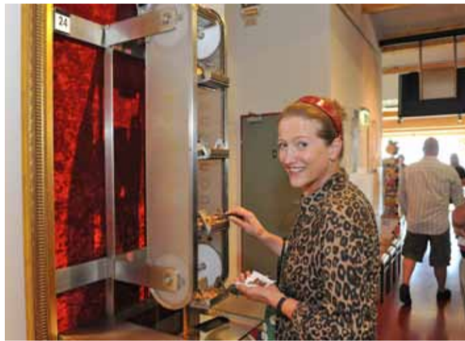
Nougat-Happen am nougus-Paternoster. Gemeinsam Labookos knacken.