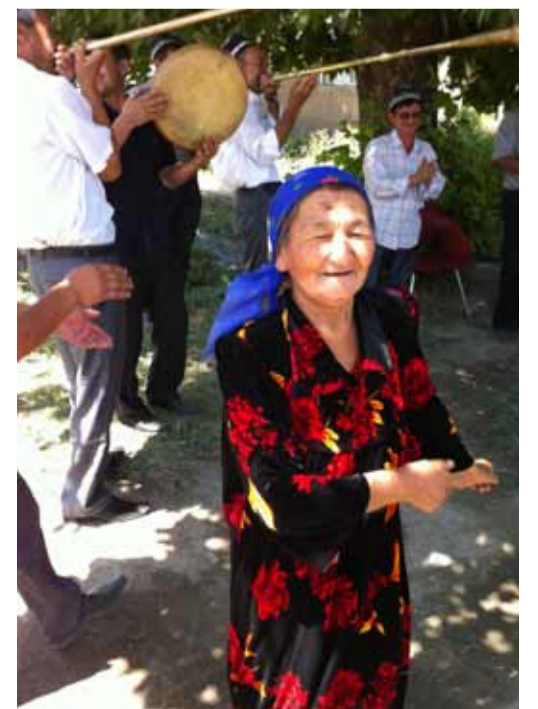
Wir wurden mit Musik empfangen