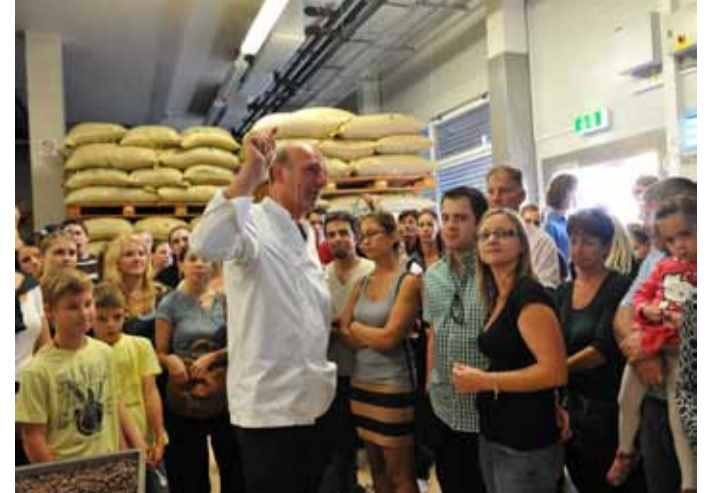
Zu Besuch im Kakaolager.

Einmal im Jahr am letzten Septemberwochenende laden wir alle Besucher zum Tag der offenen Tür ins Schokoladen-Theater und in den Essbaren Tiergarten ein.